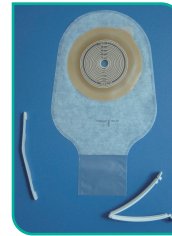
Saco de Ileostomia